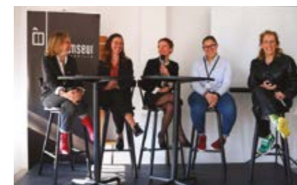
/ Mouvement de l'inclusion économique 2023