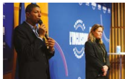
/ Sommet de l'inclusion économique 2023

Troisième Sommet de l'inclusion économique, le 28 novembre 2023 au ministère de l'Économie et des Finances ! Dirigeants d'entreprises, membres du gouvernement, associations, experts, candidats et personnalités de la société civile se rencontrent. Une journée d'actions et d'échanges sur le thème de la diversité liée aux origines. Des rencontres entre CEO, ministres et talents, un espace de recrutement, des tables rondes métiers et un forum associatif de l'inclusion pour tisser des liens.